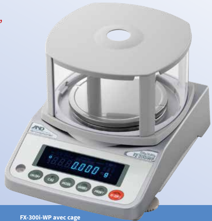
FX-3000i-WP avec cage de pesée en standard