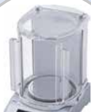
Grande chambre de pesée (option)