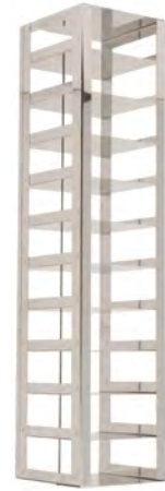
Etagères et boîtes disponibles