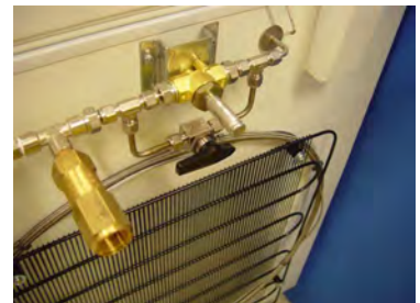
Système CO 2