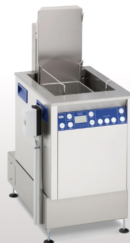
Illustration Elmasonic X-tra Line 550 Flex 1