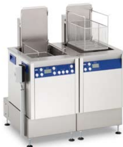
Illustration Elmasonic X-tra Line 550 Flex 2

Ligne de nettoyage modulaire se composant d'un appareil de nettoyage aux ultrasons et d'une cuve de rinçage, disponible en 5 tailles différentes (300, 550, 800, 1200 et 1600). Les appareils sont réalisés en 2 versions multifréquence : 25/45 kHz (MF2) ou 35/130 kHz (MF3). Cuve de rinçage version (S): avec chauffage (H) ou sans chauffage. Le dispositif d'oscillation du panier favorise l'efficacité du nettoyage et du rinçage, il permet aussi l'égouttage du panier (EKO). D'autre part, la ligne modulaire permet de raccorder un sécheur à air chaud (WLT), disponible dans la taille correspondante à l'appareil utilisé. Un support est compris dans les fournitures.