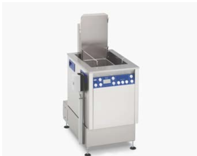
Illustration Elmasonic X-tra Line 550 Flex 1