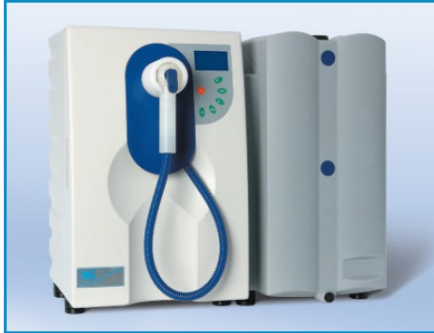
Ultra Clear TWF™ + Réservoir 30L