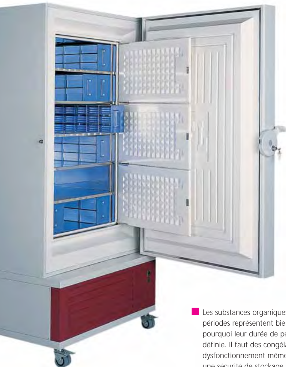
6485 Congélateur armoire, 500 litres, avec système de stockage et trois fonds intermédiaires

Le programme de congélateurs GFL comporte des coffres et des armoires de capacités de 30 à 500 litres en volume utile. Sont proposés douze congélateurs coffre avec six et six congélateurs armoire avec trois volumes utiles différents. Ces deux groupes de produits sont conçus pour des températures ambiantes jusqu'à +28 °C et des très basses températures de 0 °C à -40 °C ainsi que de -50 °C à -85 °C.