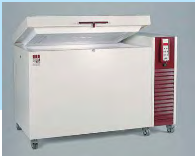
6384 Congélateur coffre, 300 litres