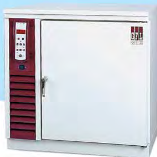
6481 congélateur armoire, 96 litres, avec plaque de couverture en version stand-alone

Autres détails: accessoires / enregistreur par points (page 13) et données techniques (pages 16 - 18).