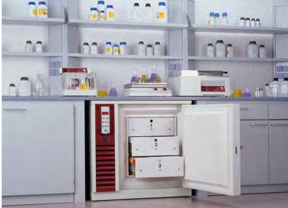
6481 Congélateur armoire, 96 litres, sous paillasse