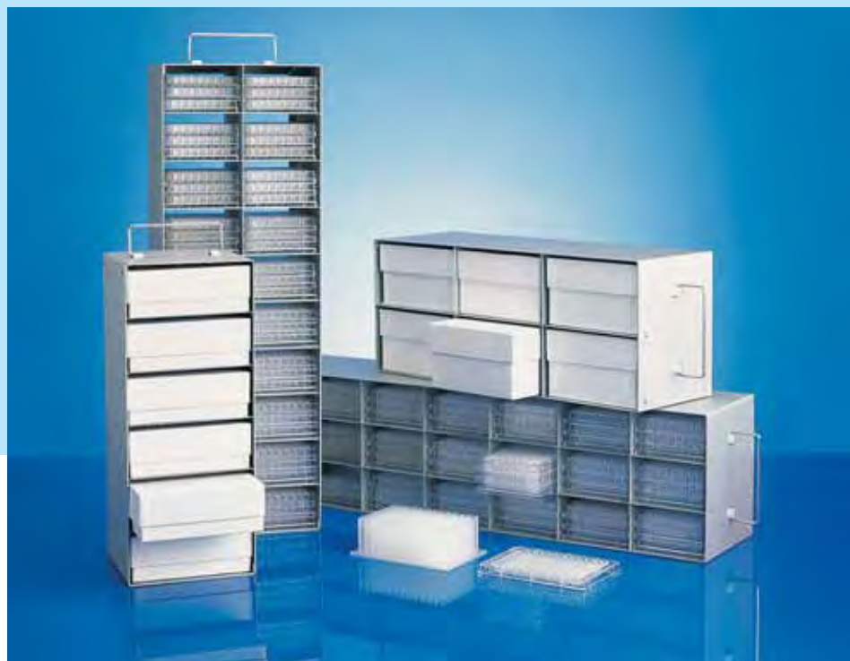
Racks de rangement du programme de rangement GFL pour boîtes, microplaques et plaques DeepWell

Boîtes (130 x 130 mm) du programme du système de stockage GFL: 6970 (H 50 mm) et 6980 (H 75 mm)