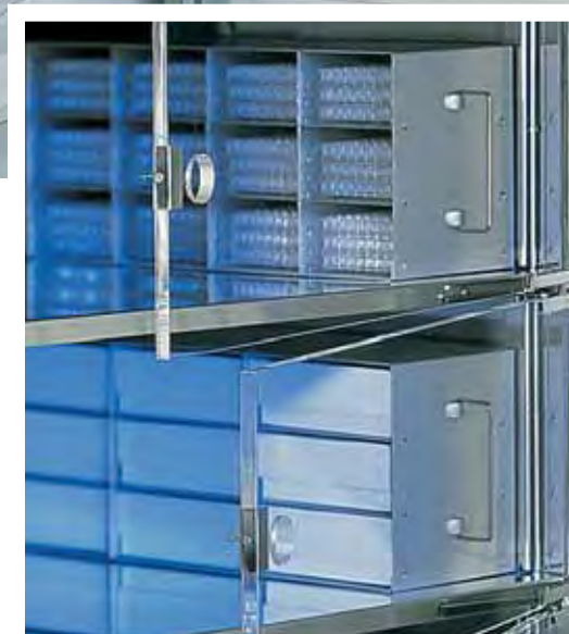
6485 Congélateur armoire, 500 litres, aménagement spécial avec cinq compartiments intérieurs et portes intérieures en verre acrylique 10 mm et poignée encastrée. Système de stockage pour plaques à microtitration et boîtes.