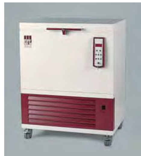
6382 Congélateur coffre, 100 litres

Le contrôle qualité intensif assure la confiance des utilisateurs. C'est pourquoi les congélateurs GFL sont testés avec des appareils de contrôle les plus modernes avant leur départ usine.