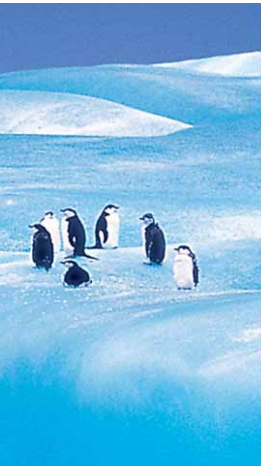
6345 Congélateur coffre, 500 litres