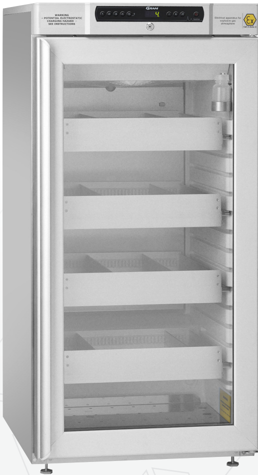
BioCompact II RR310. Des tiroirs, porte vitrée et une flacon de référence sont proposés en option.

La BioCompact II 310 est un réfrigérateur ou un congélateur avec un évaporateur ventilé.