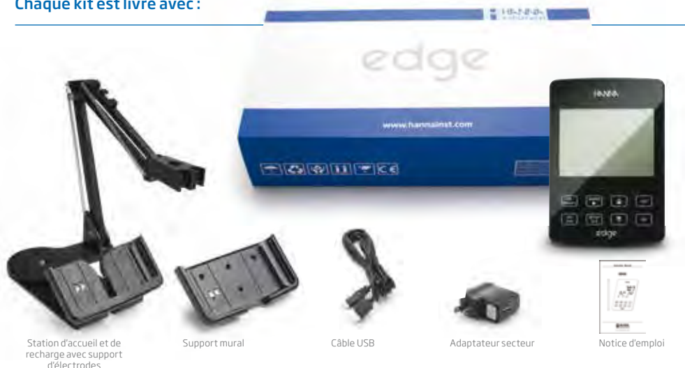
Station d'accueil et de recharge avec support d'électrodes