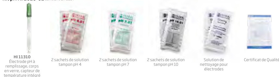
HI 11310 Électrode pH à remplissage, corps en verre, capteur de température intégré