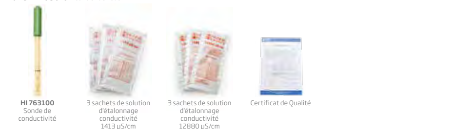
HI 76310 Sonde de conductivité