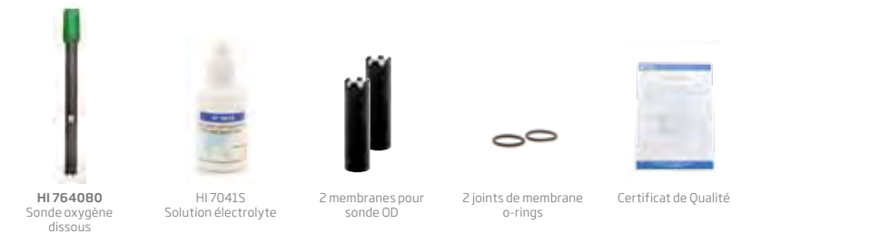
HI 764080 Sonde oxygène dissous