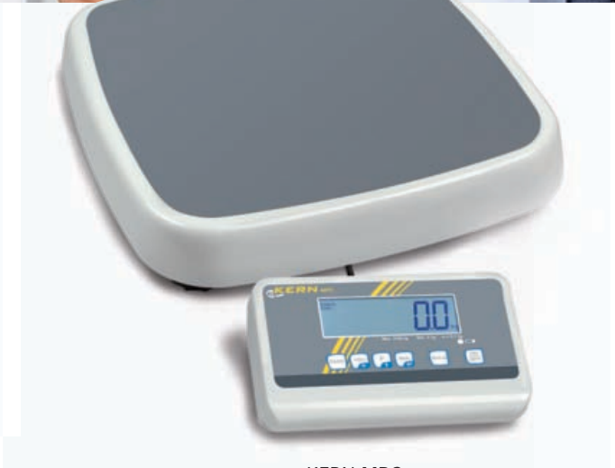
KERN MPC Pèse-personne