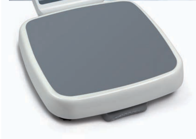
KERN MPD Pèse-personne Step-On