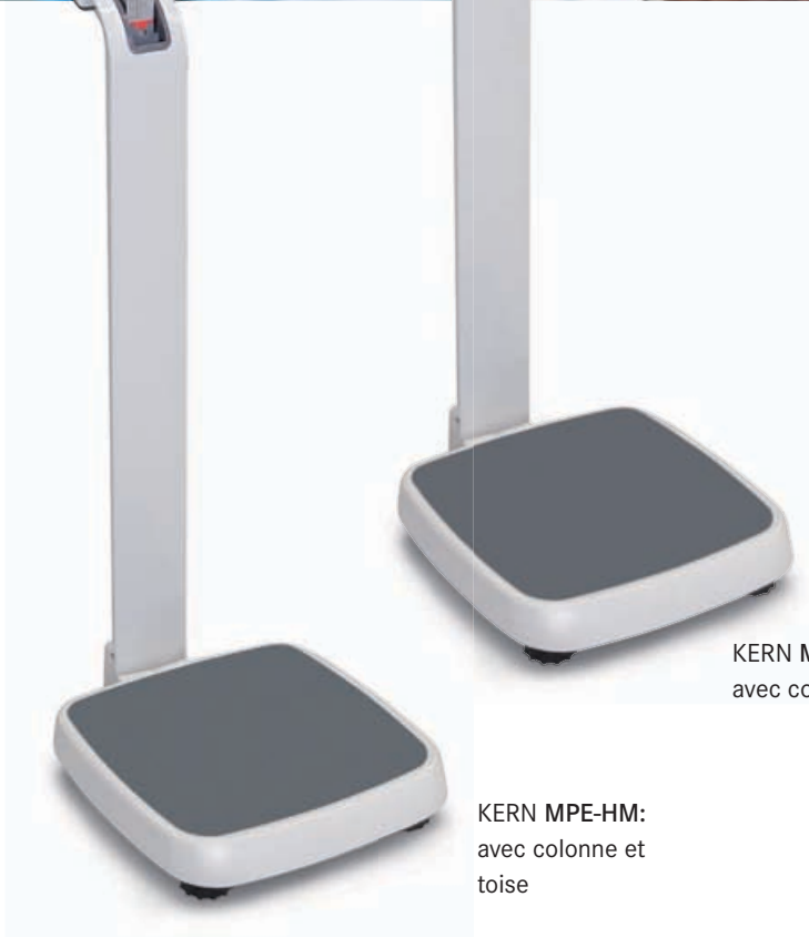
KERN MPE-PM: avec colonne