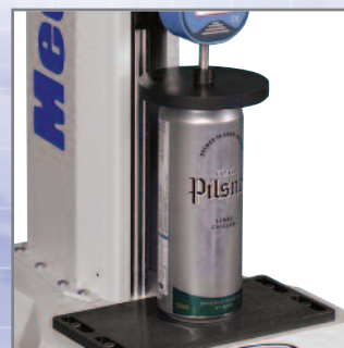
Test de compression axiale