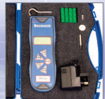
Coffret de rangement BFG + accessoires