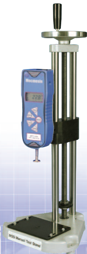
BFG fixé sur le banc d'essai manuel MDD

Fabriqué en fonte d'aluminium, le boîtier de l'AFG présente une bonne ergonomie ce qui lui permet d'être utilisé comme un instrument autonome mais aussi d'être fixé à un banc d'essai manuel ou motorisé pour réaliser des tests dans des conditions plus maîtrisées.