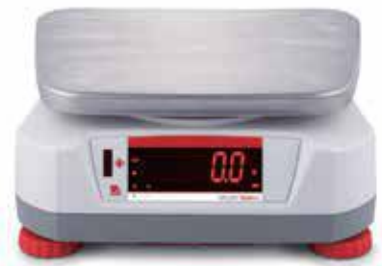
Afficheur arrière avec capteur sans contact intégré