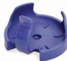
30400099 Pince flasque PVC, 125 ml