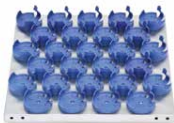
30400079 Plateau dédié, 46 × 46 cm, 125 ml