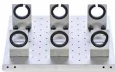
30400083 Plateau d'ampoule à décanter, 46 × 46 cm