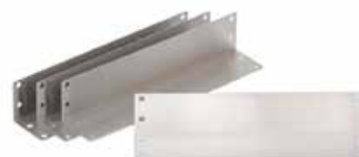
30400051 Entretoises à deux étages, jeu de 4