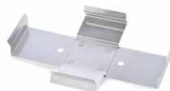
30400104 Pince microplaque en acier inoxydable