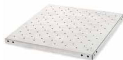
30400057 Plateau universel, 61 × 61 cm