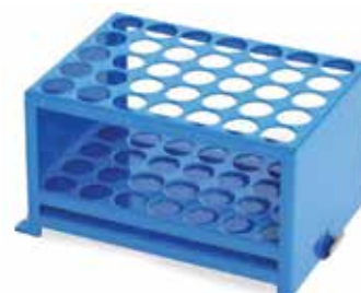
30400117 Portoir à tubes de 18 à 20 mm de diamètre