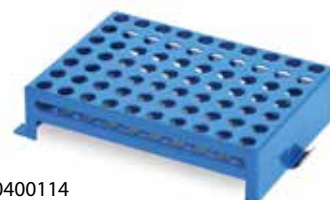
30400114 Portoir à microtubes