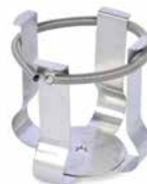
30400097 Pince bouteille de support, 500 ml