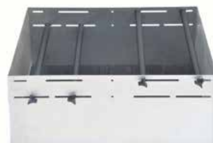
30400072 Portoir à grands récipients, 91 × 61 cm