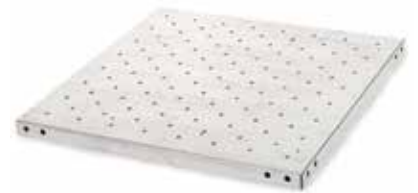
30400059 Plateau universel, 91 × 61 cm