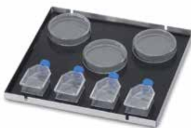
30400067 Plateau de culture avec tapis, 46 × 61 cm