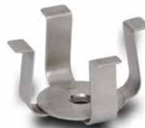
30400095 Pince flasque Erlenmeyer, 5 litres