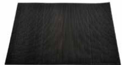
30400065 Tapis en caoutchouc, 61 × 91 cm