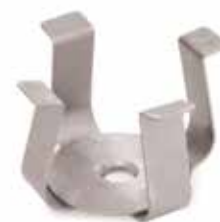
30400085 Pince flasque, 25 ml