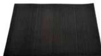
30400064 Tapis en caoutchouc, 61 × 61 cm