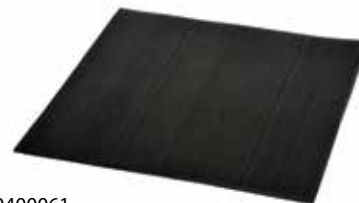
30400061 Tapis en caoutchouc, 33 × 33 cm