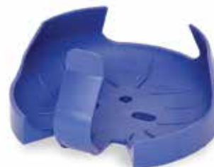
30400103 Pince flasque PVC, 2 000 ml