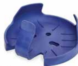
30400102 Pince flasque PVC, 1 000 ml