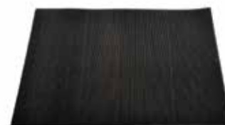
30400060 Tapis en caoutchouc, 28 × 33 cm