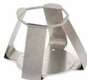
30400096 Pince flasque Erlenmeyer, 6 litres