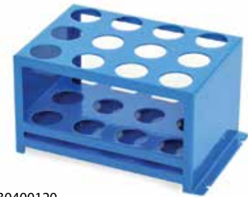
30400120 Portoir à tubes pour tubes de 50 ml