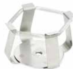
30400088 Pince flasque, 250 ml