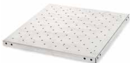
30400052 Plateau universel, 28 × 33 cm

**Les plateaux 61 × 46 peuvent être utilisés sur les agitateurs de 16 kg et de 23 kg mais sont uniquement empilables sur les agitateurs de 16 kg.