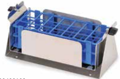
30400109 Portoir à tubes de 30 mm, pivotant