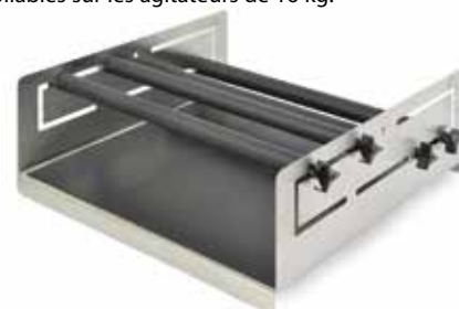
30400068 Plateau réglable, 46 × 46 cm