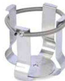
30400097 Pince bouteille de support, 500 ml